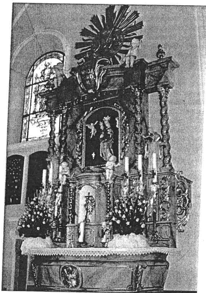
Fot.1 Ołtarz główny w kościele w Wieleniu, stan przed konserwacją.